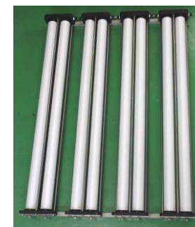
ユニット(カスタマイズ例)