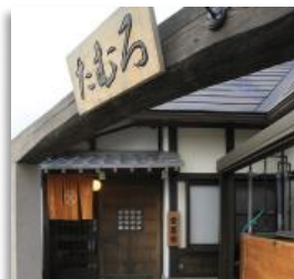
グリユー店 (各務原市)