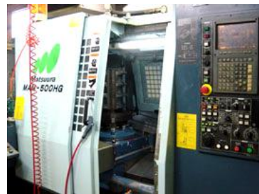
横型マシニングセンター

（株）よしいけ工業所様では、ナックのマイクロバブル発生器（商品名 Foamest 201）を導入され、水溶性切削油のメンテナンス管理に活用頂いております。