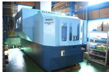
【5軸制御立型マシニングセンター】