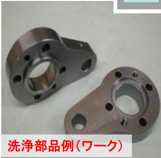
洗浄部品例(ワーク)

洗浄槽内に浮遊した油脂・ごみ等はマイクロ・ナノバブルに付着浮上し、オーバーフローにより槽外へ排水される為、汚れの再付着防止効果があります。